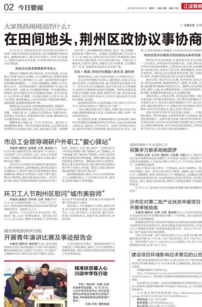
图 3 2019 年 10 月 31 日公示

在《环境影响评价公众参与办法》实施后，我公司于 2019 年 10 月 30 日、10 月 31 日在江汉商报公开了相关内容，符合《环境影响评价公众参与办法》载体要求。