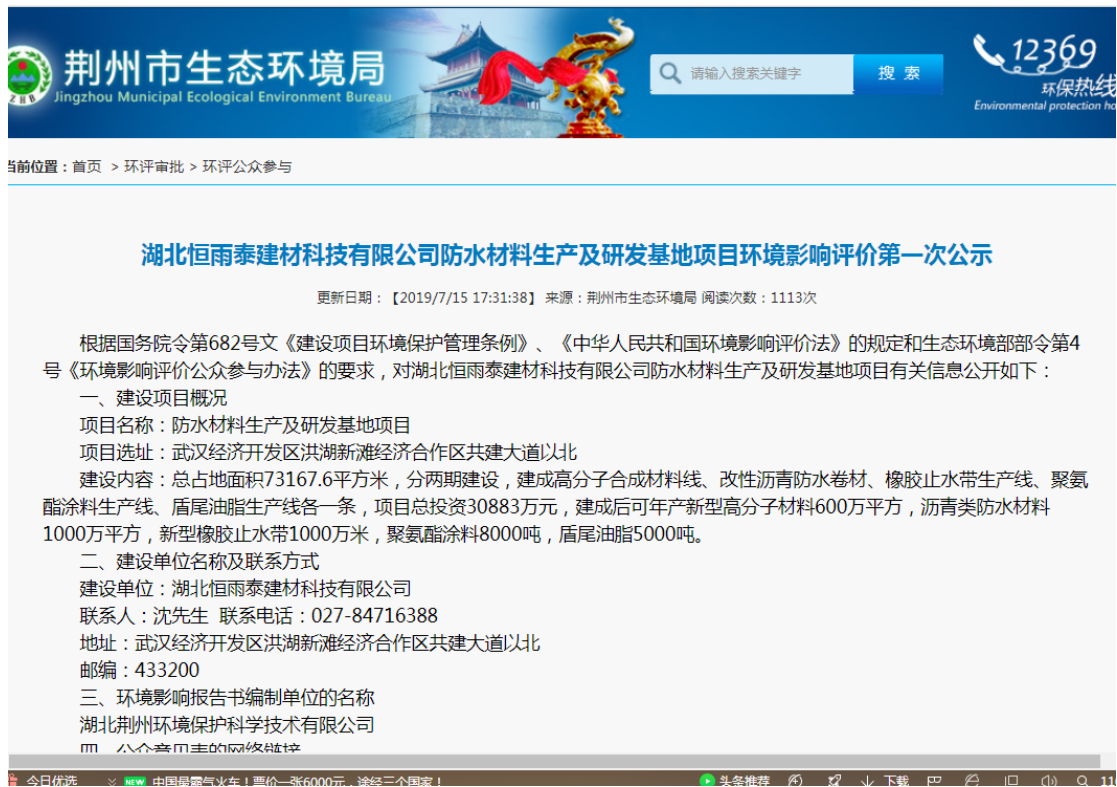
图 1 首次环境影响评价信息公开公示