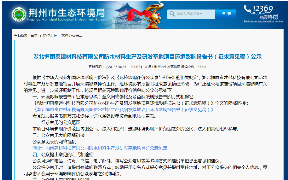
图 2 项目环评征求意见稿公示